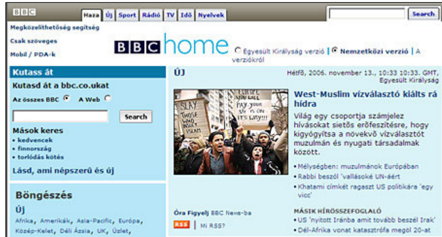
"Kiáltás rá hídra" by Dativus

amiből, ha komolyan vesszük, sanda politikai bérgyilkosság története körvonalazódik. A Dativus viszont eredeti szóhasználattal színesíti a témát, amikor közli: Cséplőgépkészítő gyanúsított gyilkoló mitter, 2 gyerek , amiből az derül ki, hogy vagy egy gépesített paraszt ölte meg az anyját, vagy fordítva, mindenesetre két gyerek maradt utánuk árván. Hogy a driver miért éppen cséplőgépkészítő, és miért nem meghajtóprogram vagy golfütő (mert az is lehetne éppen), az talány. Random működhet a dolog.